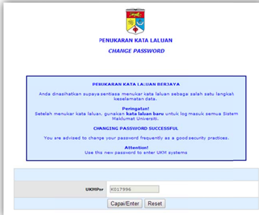
Rajah 1 (c): Penukaran kata laluan berjaya